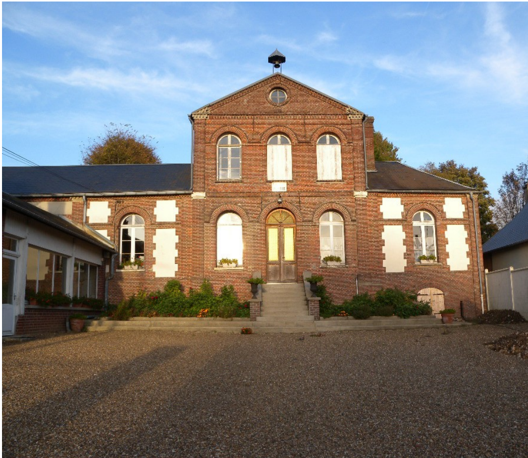
LA MAIRIE DU VAUROUX